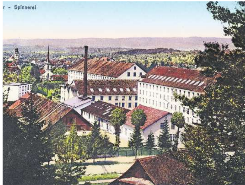
Die Spinnerei Baar: Die Aufnahme von Laura Bürgi-Heusser ist wohl zwischen 1902 und 1920 entstanden.

Es war ein Segen, als man herausgefunden