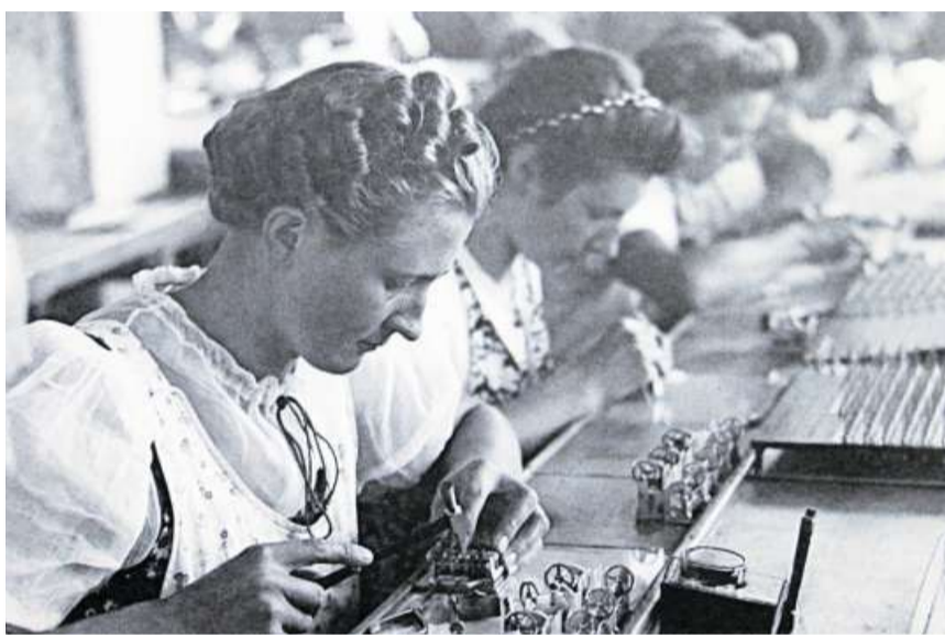
Zahlreiche Frauen arbeiteten in der Zählwerkmontage der Landis &amp; Gyr.